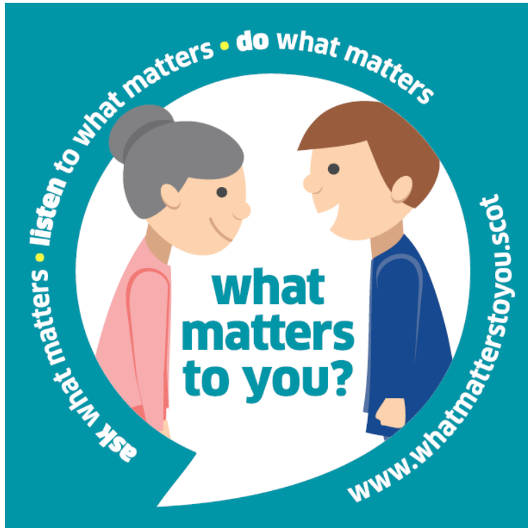
What Matters To You? Healthcare Improvement Scotland

Min vårdplan ska fokusera på och utgå från patientens behov och den ska skrivas tillsammans med patienten.