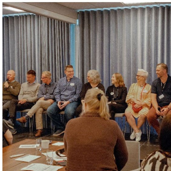
Ny förbundsstyrelse 2023.