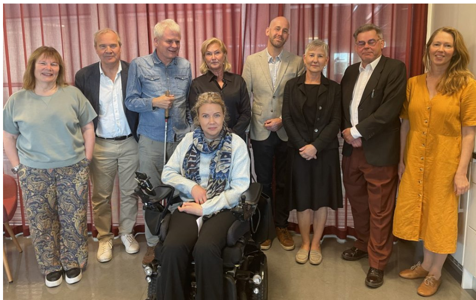
Möte med Arbetsförmedlingen.

Året slutade med välkomna uppdrag i regleringsbrev för 2025. Arbetsförmedlingen ska förbättra kontakterna med arbetsgivare, genomföra en kampanj för att fler ska anställa personer med funktionsnedsättning samt fortsätta arbetet med att påskynda identifieringen av funktionsnedsättning.